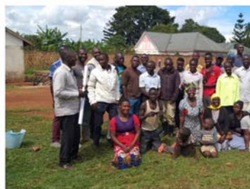
Équipe de construction de 30 frères d'Ouganda

Au début d'octobre, ils ont commencé à fabriquer des blocs de ciment pour les murs, et à la fin d'octobre, ceux d'entre eux qui sont maçons ont placé la première rangée de blocs. Chaque jour, toute l'équipe travaillait avec diligence en maçonnerie. Une consultation technique a eu lieu à des moments