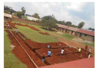
Le premier travail