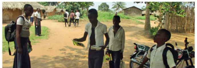
Distribution de "L'explorateur Chrétien" et "Toi, suis-moi"