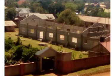
Achèvement de la 2ème phase de construction