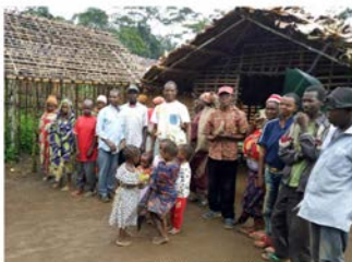
Visites et réunions aux villages du nord-est du Congo