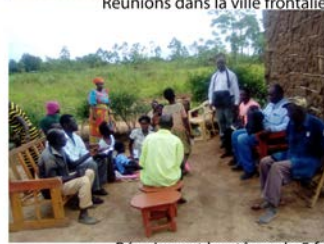
Réunions et baptême de 5 frères et sœurs en Ouganda