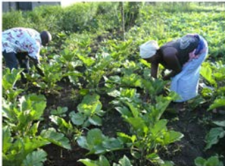
Travaux champêtres durs aux champs dans les villages