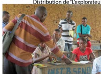
dans des écoles et villages du nord-est du Congo