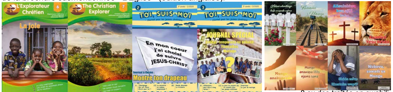
8 ex des traités en swahili

Bon nombre d'exemplaires de traités pour les jeunes ont été imprimés de janvier à septembre 2020 et distribués et / ou envoyés aux destinations finales en Ouganda, au Kenya et dans le nord-est du Congo: «Toi, suis-moi» (10 000 exemplaires chaque numéro), «L'Explorateur Chrétien» (10 000 exemplaires) et «The Christian Explorer» (15 000 exemplaires). Les exemplaires suivants pour 2020 sont maintenant à l'imprimerie et seront livrés sous peu. Cinq mille exemplaires de chaque numéro de «The Christian Explorer» sont imprimés en Afrique du Sud. Le même imprimeur a également imprimé 2 000 exemplaires de la brochure susmentionnée «L'Église» (édition anglaise).