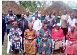
Réunions dans la ville frontalière de Busia (Ouganda / Kenya)